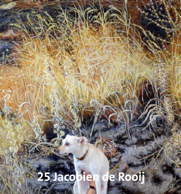
25 Jacobien de Rooij