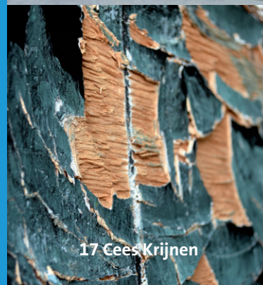
17 Cees Krijnen